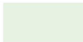
KS-3016 ミルキーグリーン