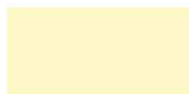
KS-3013 マスターディイエロー