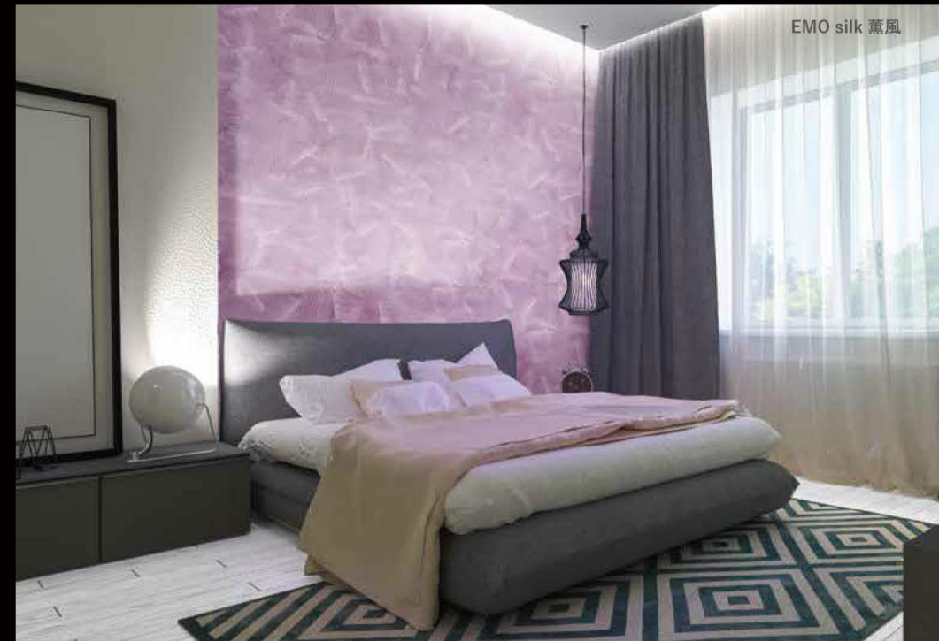
EMO silk 薫風

燦々と降り注ぐ陽光を想起させるような質感。 刷毛とプラスチックヘラで表現するペイント。