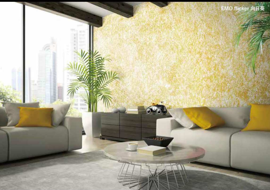
EMO flicker 向日葵